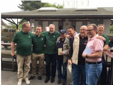
Die erfolgreichen Schützen (Im Hintergrund der König)