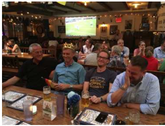
Der „Noch König im Hofbräuhaus