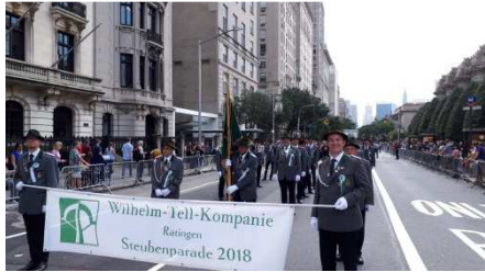
Auf der Parade