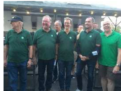
Die erfolgreichen Schützen