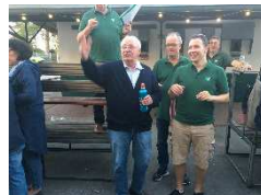
Er hat es verdient