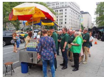
das erste Würstchen