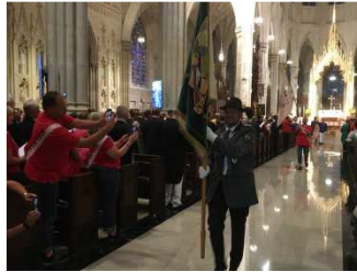
Auszug der Fahmenträger