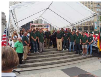
Empfang der Gruppe