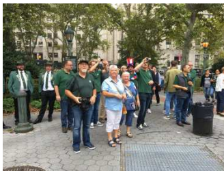
Beim Empfang am Rathaus