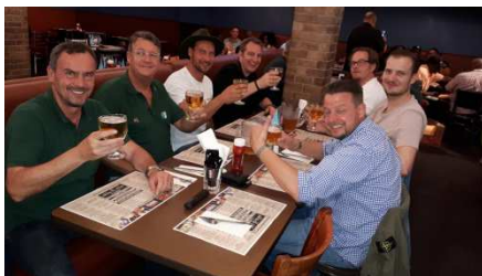
im BBQ Dallas- Restaurant