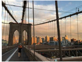
Die Brooklyn Bridge