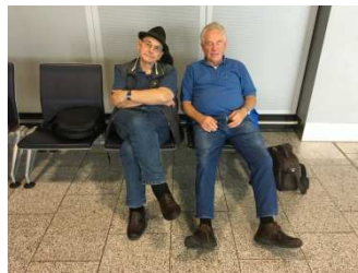
Auf dem Weg nach New York