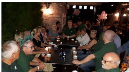
Feier!!!-abend im Irish-Pub