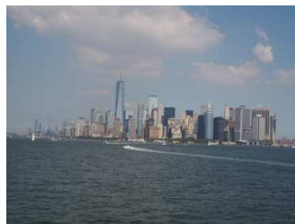
Manhattan von der Fähre