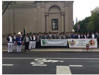
Ratingen / Neuss