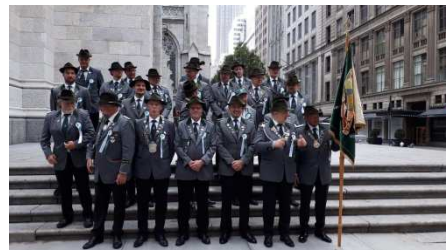
vor der Kathedrale