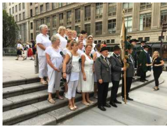
unsere wunderschöne Begleitung