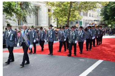
vor der Ehrentribüne