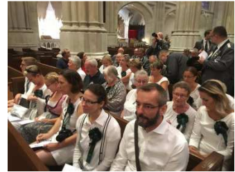
In der Kathedrale