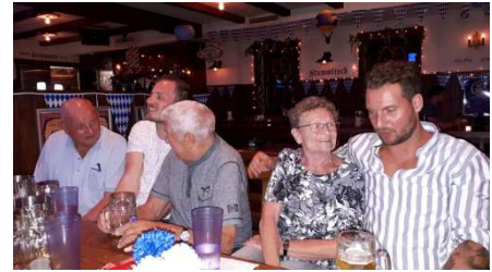
Ob alt oder jung: Wilhelm-Tell- Kompanie

Weitere Eindrücke von der Messe in der St.Patrick's Cathedral sind hier im Film festgehalten.