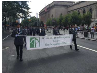
Parade 5. Avenue